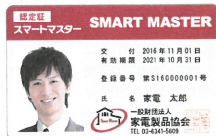
※ スマートマスターの認定証(イメージサンプル)

なお、家電製品協会では、現在、「スマートマスターに相談できる店・オフィス」の申請・登録手続を進めており、11月21日(月)には、消費者の皆さまに対し、地域ごとに『スマートマスターのいる店』としてご紹介する計画です。