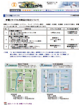
「家電リサイクル対象品の処分について」ページ