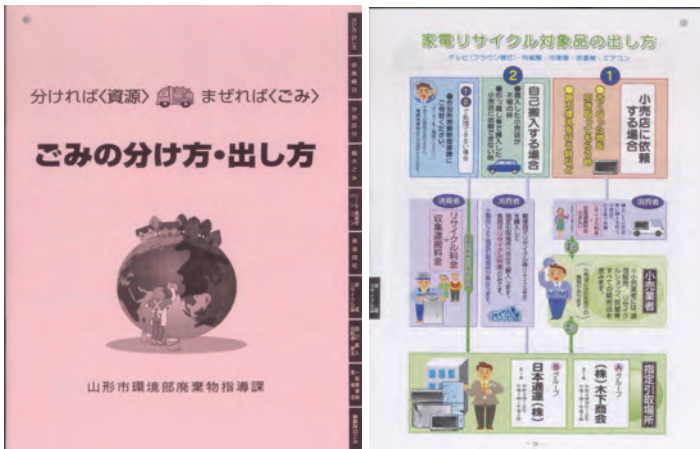
「家電リサイクル対象品の出し方」ページに家電 4 品目の処分方法を掲載