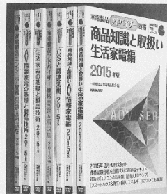
技術やトレンドの変化に合わせて毎年更新される参考書

新ができる。次回(3月)の試験は、3月10日(日)にアドバイザー資格とエンジニア資格の試験を実施する。受験申請は認定センターホームページで申し込み。締め切りは1月26日(日)。