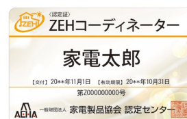
カード型認定証 例