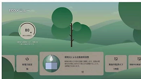
リアルタイムで消費電力量の確認が可能に