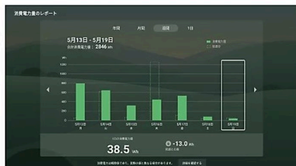
消費電力レポートの確認が可能に