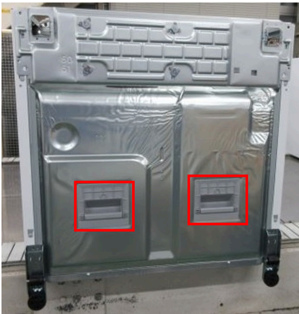
難燃リサイクルプラスチックを採用した運搬用取手部品