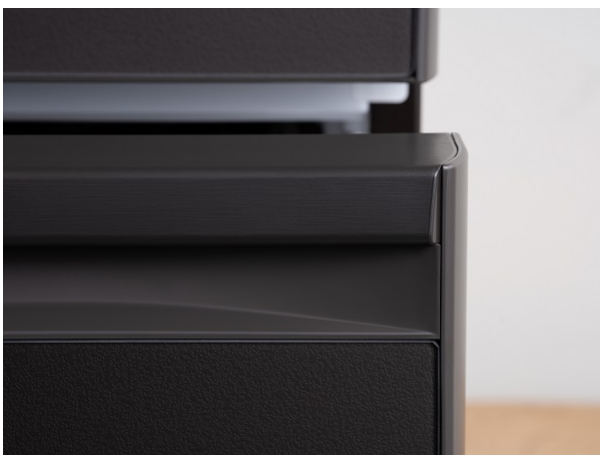
ヘアラインシボデザインを採用した引出しハンドル部品